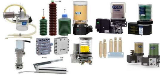
Hệ thống bơm mỡ